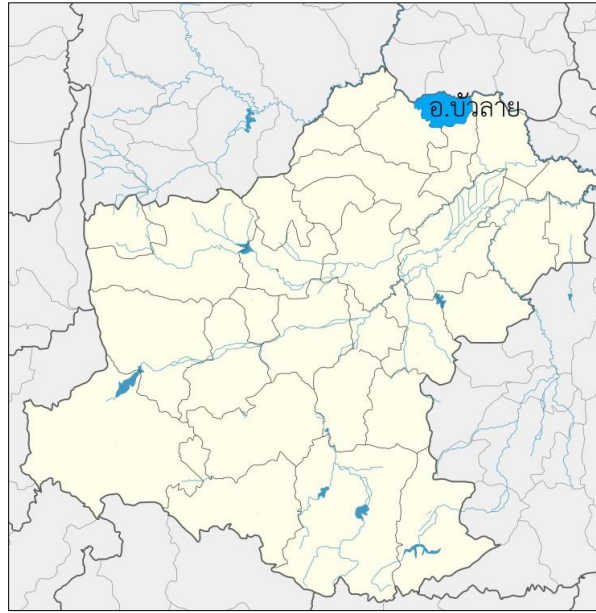
จังหวัดนครราชสีมา

ขอบเขตพื้นที่ปลูกและผลิต มะม่วงน้ำดอกไม้สีทองบ้านแฮดขอนแก่น ครอบคลุมพื้นที่ 5 อำเภอ ของ 3 จังหวัด ประกอบด้วย จังหวัดขอนแก่น 3 อำเภอ ได้แก่ อำเภอบ้านแฮด อำเภอเปือยน้อย และอำเภอบ้านไผ่ จังหวัดนครราชสีมา 1 อำเภอ ได้แก่ อำเภอบัวลาย และจังหวัดมหาสารคาม 1 อำเภอ ได้แก่ อำเภอโกสุมพิสัย