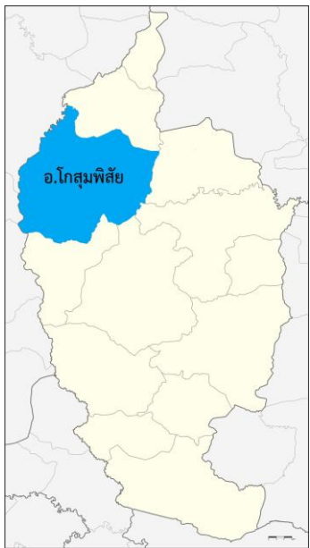
จังหวัดมหาสารคาม