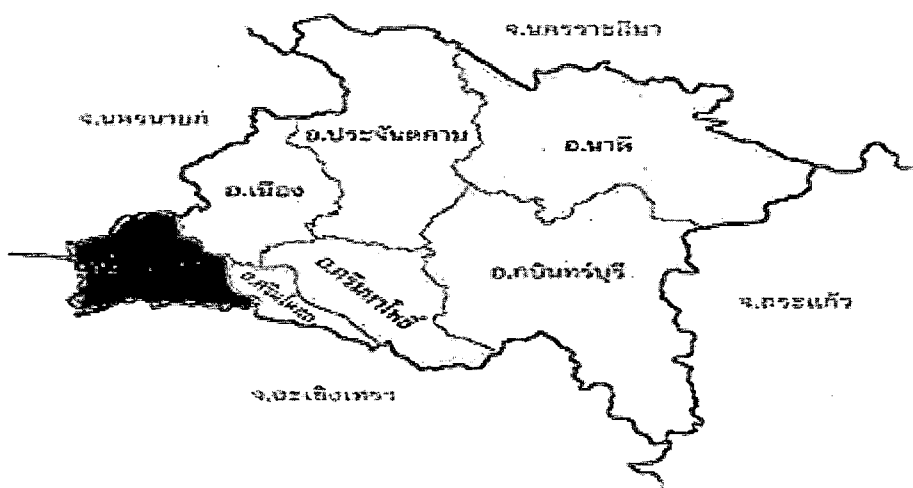
แผนที่จังหวัดปราจีนบุรี