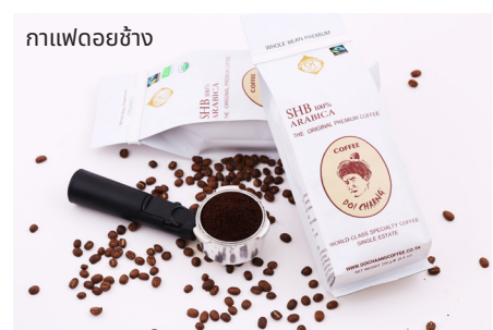
กาแฟดอยช้าง

หรือหากต้องการชมทิวทัศน์อันงดงามใน อ.แม่สรวยนี้ก็ยัง มี ดอยช้าง เป็นจุดชมดอกพญาเสือโคร่งที่นับว่าใหญ่ที่สุดของเมืองไทย เพราะมีมากถึง 400,000 ต้น จากนั้นแวะช้อปปิ้ง “กาแฟดอยช้าง” กาแฟอาราบิก้าสายพันธุ์หลักคาทุยรา คาติมอร์ และคาทุยที่ได้จากผลกาแฟสดที่ปลูกในหุบเขาดอยช้าง ต.วาวี อ.แม่สรวย นำมาผลิตด้วยกรรมวิธีมาตรฐานเป็นกาแฟสารและกาแฟคั่ว - บด