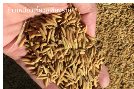
ข้าวเหนียวเขี้ยววงเชียงราย

ขึ้นดอยชมวิวสูงที่ ดอยผาหมี หมู่บ้านเล็กๆ ใน ต.เวียงพางคำ อ.แม่สาย ที่ล้อมรอบไปด้วยทิวทัศน์ของขุนเขาและผืนป่าขนาดใหญ่ แหล่งท่องเที่ยวสุดฮิปที่นักท่องเที่ยวนิยมมาพักผ่อนในบรรยากาศสบายๆ แบบโฮมสเตย์และเช็คอินร้านกาแฟวิวตระการตา ก่อนกลับอย่าลืมหาโอกาสชิม “ข้าวเหนียวเขี้ยววงเชียงราย” หรือ ข้าวเหนียวพันธุ์เขี้ยววง 8974 ของดังของที่นี่ ข้าวเหนียวพันธุ์พื้นเมืองที่มีเมล็ดเล็กเรียวยาว สีขาวขุ่น เมื่อนึ่งสุกแล้วนุ่มเหนียวติดกันแต่ไม่เหนียว มีความเลื่อมมันค่อนข้างมาก และมีกลิ่นหอม ข้าวคั้นตัวเร็วและไม่แข็งปลูกในพื้นที่ อ.แม่สาย อ.เชียงแสน อ.แม่จัน และอ.พาน หากชิมแล้วติดใจ อย่าลืมแบ่งปันความอร่อย โดยซื้อกลับไปเป็นของฝาก นอกจากคนรับจะอึ้งใจแล้วยังสามารถช่วยสร้างรายได้ให้กับชุมชนได้มากทีเดียว