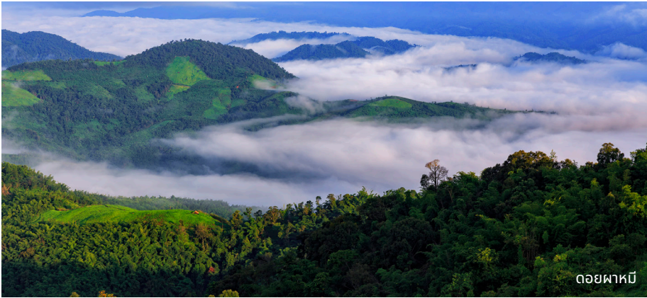
ดอยผาหมี

ที่มีคุณภาพสูง มีความหอม รสชาติกลมกล่อม ที่เป็นเอกลักษณ์เฉพาะตัว