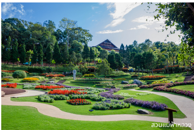
สวนแม่ฟ้าหลวง