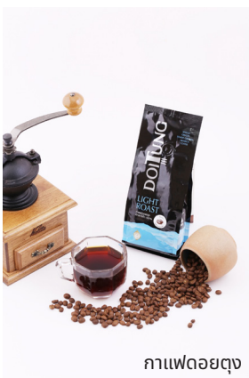
กาแฟดอยตุง