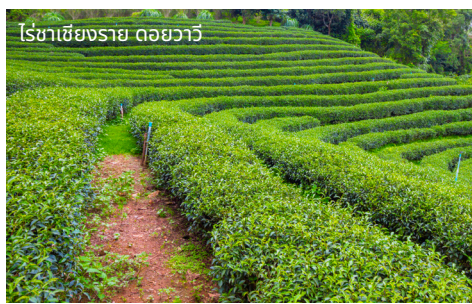
ไร่ชาเชียงราย ดอยาวี

นอกจากนั้นบนดอยตุงยังมีลานกางเต็นท์พักร่มสำหรับชมทะเลหมอกในยามเช้าให้คุณได้สร้างบรรยากาศอันรื่นรมย์พร้อมจิบ “กาแฟดอยตุง” สักแก้ว เพราะที่โครงการพัฒนาดอยตุงบนเทือกเขานางนอนนี้เป็นแหล่งปลูกของกาแฟดอยตุงที่มีชื่อเสียง ด้วยเสน่ห์อันสมบูรณ์แบบของกาแฟสายพันธุ์อาราบิก้าที่เป็นลูกผสม 3 สายพันธุ์ คือ สายพันธุ์คาติมอร์ สายพันธุ์คาทุยรา และสายพันธุ์คาทุย ที่มีการผลิตกลับไปยังสายพันธุ์คาทุยรา 4-5 ช่วง เพื่อให้เกิดคุณสมบัตินี้ที่ผลิตเป็นสารกาแฟ และกาแฟเม็ดบดบนพื้นที่โครงการพัฒนาดอยตุงมีกลิ่นหอมและรสชาติอันกลมกล่อม จึงเหมาะสำหรับดื่มดำไปกับอากาศยามเช้าและซื้อเป็นของฝากที่สุด