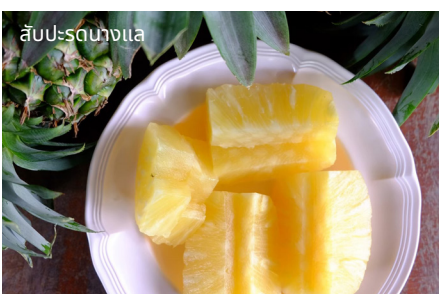
สับปะรดนางแล

นอกจากนี้ที่นี่ยังมีแหล่งท่องเที่ยวให้ได้พักผ่อนหย่อนใจอีกมากมาย ไม่ว่าจะเป็นที่พักในรูปแบบโฮมสเตย์ที่มาพร้อมวิวท่ามกลางหุบเขา นาข้าวขั้นบันได น้ำตกนางแลในหากรู้สึกเมื่อยล้าแนะนำให้ไปนวดผ่อนคลายสไลด์ลำนานาที่โฮงฮ่อมผญา (ศูนย์เรียนรู้ชุมชนตำบลนางแล) วัดพระธาตุดอยเือง หรือจะเที่ยวเล่นชมวิถีชีวิตชนเผ่าอาข่าและลีซอ ที่หมู่บ้านลีซอ