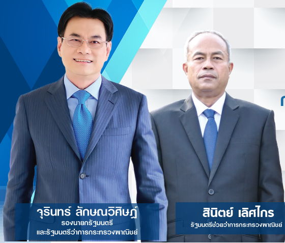
จูนินทร์ ลักษณ์วิศิษฏ์ รองนายกรัฐมนตรี และรัฐมนตรีว่าการกระทรวงพาณิชย์