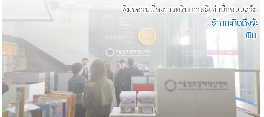
พิมพ์ชอบเรื่องราวทวีปเกาหลีเท่านี้ก่อนนะจะ รักและคิดถึงจัง พิมพ์

พิมพ์เล่าเรื่องมาเสียยาว นึกคงจะเห็นภาพว่า พิมพ์ประทับใจกับการเดินทางเยือน เกาหลีครั้งนี้แค่ไหน พิมพ์มองว่า ประเทศไทยเรามีศิลปวัฒนธรรมที่สวยงามและสืบทอด กันมายาวนาน มีผู้ประกอบการ เยาวชนรุ่นใหม่ที่มีความคิดสร้างสรรค์ดี ๆ หากได้ คำแนะนำ มีที่ปรึกษาหรือพี่เลี้ยงที่มีความเชี่ยวชาญ ได้รับแรงสนับสนุนจากภาครัฐ และเอกชนในเรื่องที่จำเป็นต่างๆ น่าจะเป็นแรงผลักดันขับเคลื่อนให้อุตสาหกรรม สร้างสรรค์ของไทย ซึ่งมีมูลค่าคิดเป็นร้อยละ 14 ของ GDP ให้ก้าวหน้าต่อยอดไปได้ เช่นกัน