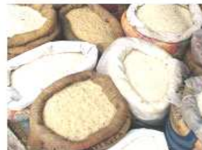
เมล็ดข้าวหอมมะลิ ทุ่งกุลาร่องไห

ข้าวหอมมะลิทุ่งกุลาร่องไหเป็นข้าวไวแสง ปลูกได้เพียงปีละครั้งในระหว่างเดือนเมษายน- สิงหาคมและเก็บเกี่ยวในช่วงเดือนตุลาคม ธันวาคม หลังจากนี้จึงมีการวางพื้นที่ต่อความชื้น ในการ ปลูกจะใส่มะลิตั้งหัวข้าวดอกมะลิ 105 และ กก 15 เท่ากัน มาปลูกในทุ่งกุลาร่องไหซึ่งมีสภาพเป็น แอ่งกระแสน้ำใหญ่ พื้นที่เป็นลูกคลื่น สูงต่ำ สลับกัน สูงจากระดับน้ำทะเล 200 เมตรและเป็น ดินร่วนปนทราย ซึ่งมีการใช้ดินเค็มและซัลเฟต ที่มีความอุดมสมบูรณ์ต่ำ ขาดสังกะสีและสังกะสีขาว ปลูกข้าวชนิดนี้ในภูมิประเทศที่มีความแห้งแล้ง ของพื้นที่ และความเค็มในดินก่อให้เกิดปัญหา ขาดพื้นที่ปลูกและขาดน้ำโดยเฉพาะเมื่อผนวกกับสภาพ อากาศและธาตุอาหารในดิน ส่งผลให้ข้าวเกิด ความเครียด และผลิตสารเคมี 2-acetyl-1-pyratone (2-A-1-P) ส่งผลให้ข้าวมีความหอมมากกว่าข้าว หอมจากแหล่งอื่น นอกจากนี้ที่เมล็ดข้าวมีรูป รางวงเรียวยาว ไม่มีรอยแตกและเปลือกมีสีฟ้าเมื่อ รับประทานและไม่มีสารพิษตกค้างและมีการ คุ้มครองพันธุ์ข้าวพันธุ์นี้จากโจรสลัดข้าวชาติใน ดินแดนแห่งนี้ซึ่งขยายถึงสหภาพการค้าข้าวตอน ใต้จีนด้วย