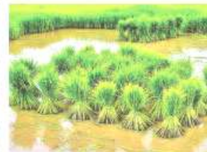
นาปลูกข้าวเจ้ากขยคู่เสาคู่

ต่อมาเมื่อปี พ.ศ. 2546 ทางศูนย์วิจัยข้าว ปทุมธานี ได้รวบรวมชาวนาผู้ปลูกข้าวเจ้ากขย คิดเมล็ดเพื่อไม่ให้สายพันธุ์สูญพันธุ์ จนได้ข้าว พันธุ์เจ้ากขยคู่เสาคู่ เป็นชาวจีนที่มีลักษณะเมล็ด ข้าว มีน้ำหนักเมล็ดดี ข้าวสุกจะขึ้นเหนียว และสีข้าวสุกสวยงามไม่เกาะเป็นก้อนจึงมี สันภาพสูงเกินใช้ทำนึ่งโดยไม่มีกลิ่นเสีย มีความ แยกต่างจากสินค้าชนิดเดียวกัน จนต่อมาได้รับ การขึ้นทะเบียนเป็นสิ่งบ่งชี้ทางภูมิศาสตร์ ข้าวเจ้า กขยคู่เสาคู่ ในปี พ.ศ. 2551 และถึง ความเห็นการขึ้นเครื่องหมายแหล่งผลิตข้าวที่มี คุณลักษณะโดดเด่น มีความเป็นแบบและชื่อเสียง ดังนั้นได้ทำสิ่งบ่งชี้ในลักษณะ