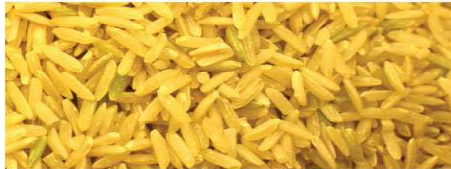
นาปลูกข้าว เมืองประทิว ประธานกลุ่มบ้าน ตำบลนางสนม อำเภอประทิว จ.บุรีรัมย์

ชนชาวกูยไทยมีวัฒนธรรมการดำรงชีพแบบพึ่งพาตนเองพึ่งพาผืนดินทำกินแบบดั้งเดิมและธรรมชาติแวดล้อมเป็นหลัก พื้นที่อำเภอวาปีปทุมมีอำเภอทั้งโพน และอำเภออากาศอำนวย ถือเป็นแหล่งผลิต "ข้าวอาจ" คุณภาพดีตั้งแต่อดีตจนเป็นตำนานสืบสานกันมาจนถึงปัจจุบัน